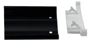
Vue de lame face interne

Nous vous proposons en exclusivité une nouvelle version de cette option avec plus de résistance et de simplicité de pose grâce à son système de clips traversants.